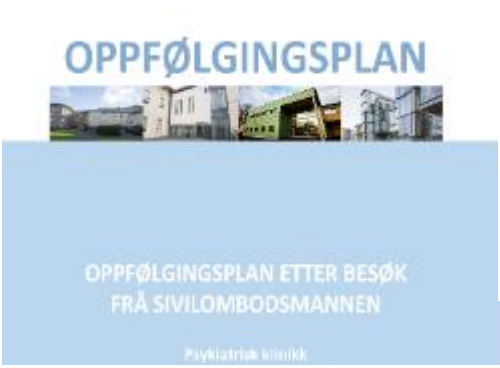
Forbedring fysiske forhold